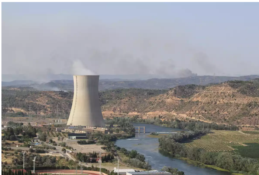
Els municipis de les àrees nuclears d'Ascó i Vandellòs custodien les pastilles de iodur potàssic.